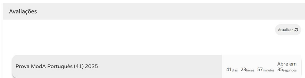
Figura 2 – Acesso à prova a realizar