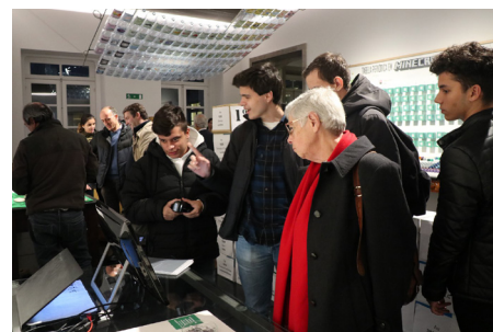
Alunos do Curso Profissional Técnico de Multimédia

Foi publicada, a versão web da tabela periódica interativa realizada pelos alunos do atual 12 M do Curso Profissional Técnico de Multimédia e que obteve o terceiro prémio no concurso "Tabela Periódica: para além dos 150 anos", promovido pela FEUP, ISEP, FCUP e Sociedade Portuguesa de Química, no ano letivo 2019/20.