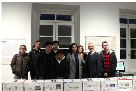
Alunos do Curso Profissional Técnico de Multimédia