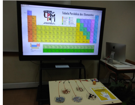
Fotografia - Quadro Interativo 4K Tabela Periódica - Sala informática 3 | CPTM